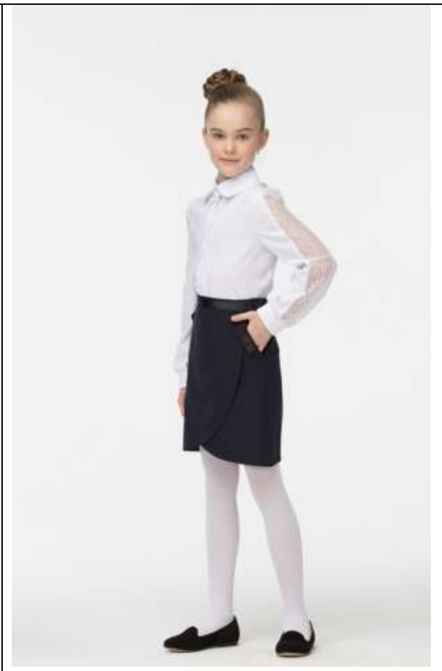
http://smenawear.ru форма СМЕНА